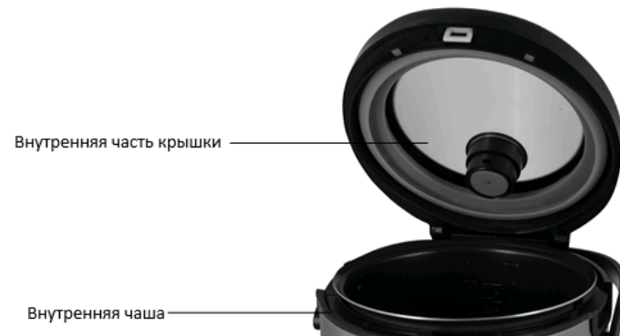
Внутренняя часть крышки